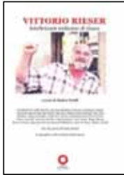
VITTORIO RIESER Intellettuale militante di classe a cura di Matteo Gaddi Edizioni Punto Rosso 2015, 18 euro

costituisce l'atto fondativo dell'esperienza dell'operaismo italiano. Vittorio Rieser fu una delle espressioni più emblematiche della critica da sinistra al Pci, ambito culturale da cui nacque l'operaismo quale ritorno a una centralità operaia non più subalterna, nella sua espressione politica, a un soggetto esterno organizzato quale il partito. Una revisione teorica del paradigma leninista che si intersecò negli anni sessanta con il favore che incontrarono in Europa le tendenze maoiste di vario tipo. È proprio all'incrocio di queste due tendenze: comprendere in pieno lo sviluppo produttivo italiano e le sue ricadute nel mondo del lavoro, e l'insufficienza del soggetto politico comunista «ufficiale», che si situa l'esigenza per numerosi militanti di ritornare al Marx del Capitale , lo studioso dei processi sociali insiti nel rapporto di lavoro capitalista. Rifiutare le